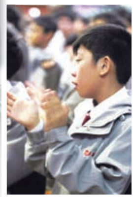
聖誕崇拜同學積極投入跟著節奏拍掌唱詩