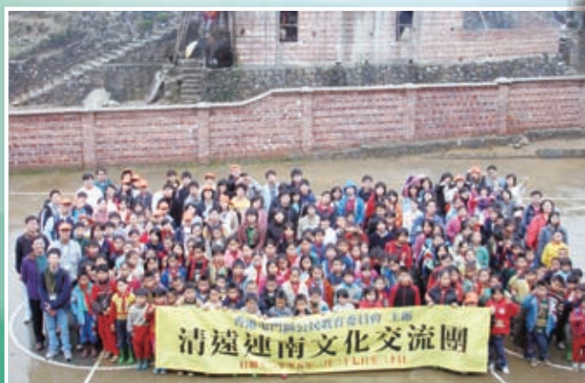
清遠連南文化交流團