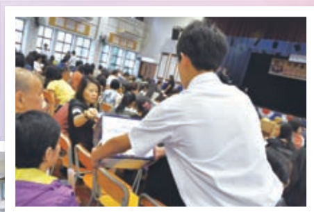
家長踴躍投票，成功選出第八屆家教會常務委員