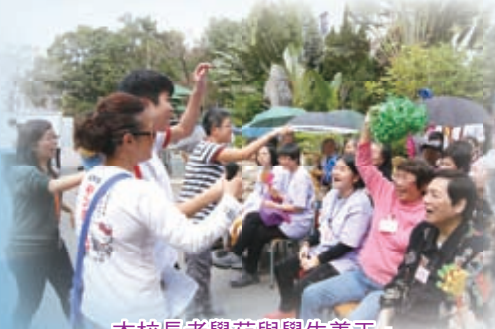
本校長者學苑與學生義工，為區內長者送上關愛和歡樂