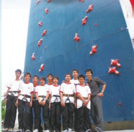
由香港攀山總會興建的全港唯一速度賽標準牆， 培養同學堅毅不屈的鬥志。