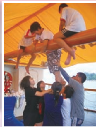
齊心合力，眾志成城