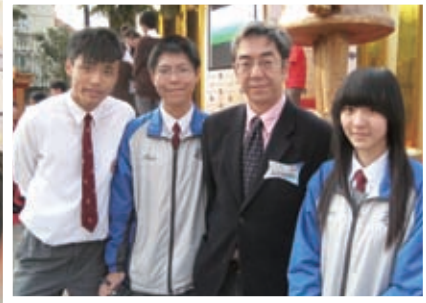
通識學習活動，一嚐小記者滋味