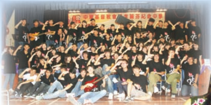
龐大音樂佈道隊到校為中一級迎新活動領會