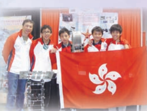
本校學生代表香港首奪美國洛杉磯世界VEX機械人錦標賽創意大獎