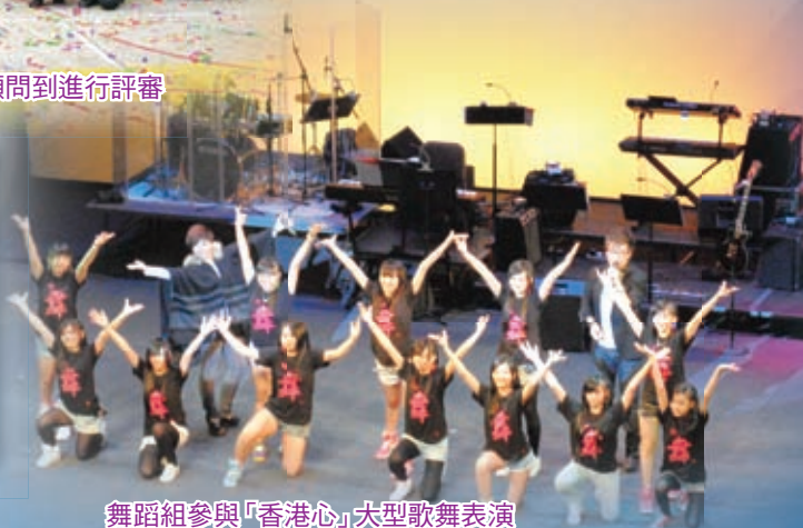
舞蹈組參與「香港心」大型歌舞表演