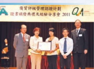
本校榮獲優質評核管理認證獎