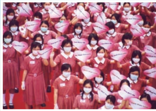
心連心抗炎活動日