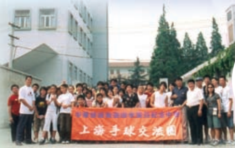
到姊妹學校上海建青實驗中學交流