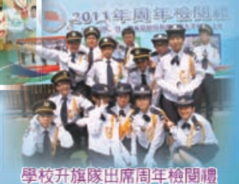
學校升旗隊出席周年檢閱禮