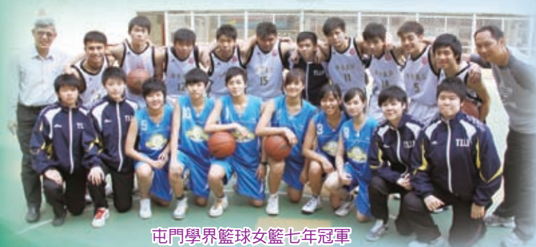
屯門學界籃球女籃七年冠軍