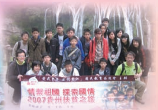
情繫祖國 探索國情