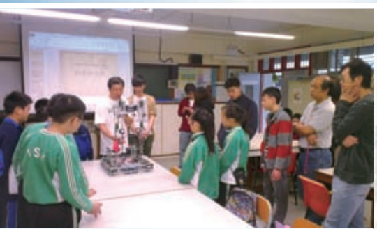
機械人培訓工作坊