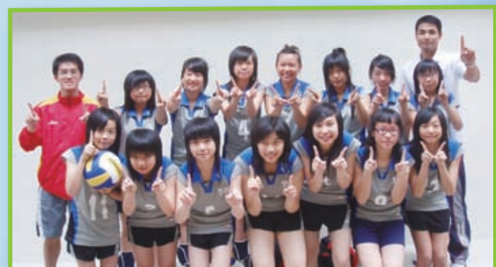
排球隊榮獲屯門區校際排球比賽冠軍