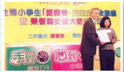
本校學生榮獲職業安全發明比賽冠軍