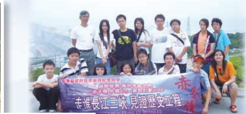
長江三峽歷史考察團