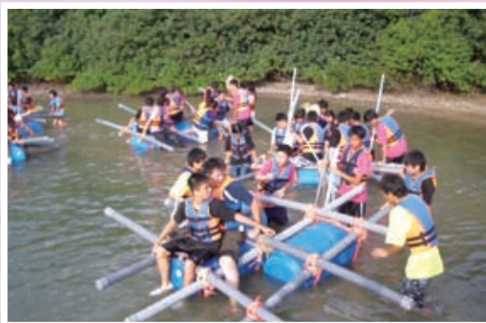
團結就是力量——領袖訓練營