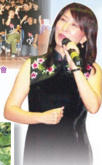
歌星蔣麗萍小姐到校作佈道會見證嘉賓