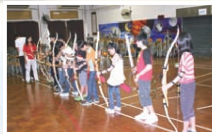
暑期中一射箭體驗班