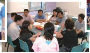
參與新加坡老師學習圈培訓