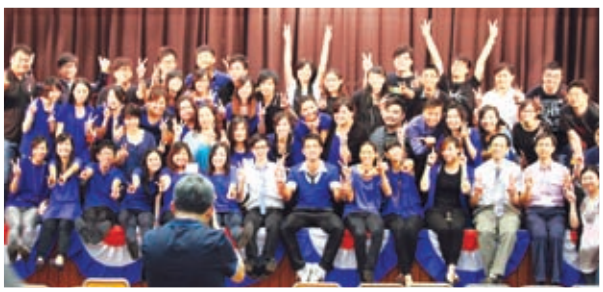
ACM團隊到校進行屬靈培育