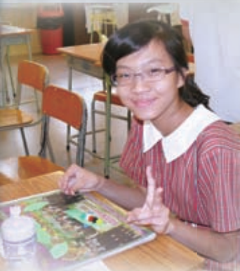
同學於福音周藉製作福音毛毛蟲了解福音真意