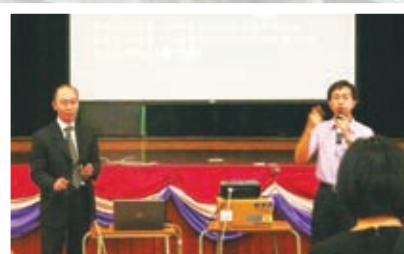
天文台科學主任於宗教周會分享恩寵之星