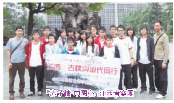
「赤子情 中國心」江西考察團