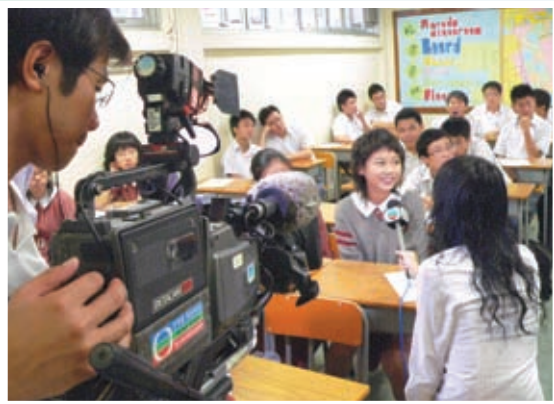
學生口才過人——傳媒專訪