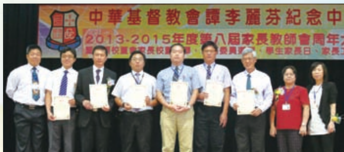
老師成功為學校增取了不少校外資源,學生實在得益不少