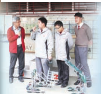
校長於早會訪問機械人比賽冠軍隊員，讓學生自信地講述比賽詳情