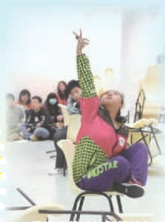
藝術大使示範靜態的舞蹈

學校推行「一生一體藝」的理念，積極推動藝術及體育活動，同學在藝術和體育領域，發揮潛能。學校透過多元化課外活動讓學生陶冶性情，強身健體，更讓他們從持續的學習和訓練中，經歷挫折，面對困難，從而培養他們積極自信、堅毅不屈的精神。憑著師生的努力，本校的手球、壘球、籃球、排球、空手道、足球、攀石、保齡球、臥推舉校隊都屢創佳績。而女子手球隊、男子籃球隊、足球隊、攀石隊、保齡球隊、壘球隊及健體隊，屢獲全港學界比賽冠軍，成績彪炳。