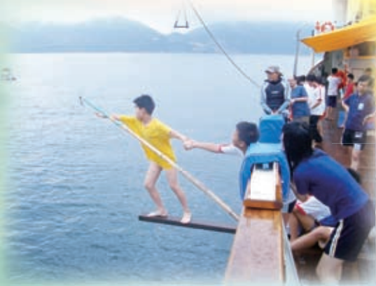
乘風航——挑戰自我，提升抗逆能力