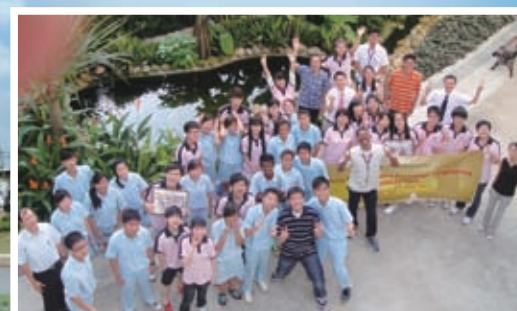
探訪新加坡姊妹學校