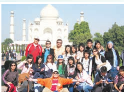
英語學習之旅，同學到印度考察泰姬陵，親身體驗異國文化。