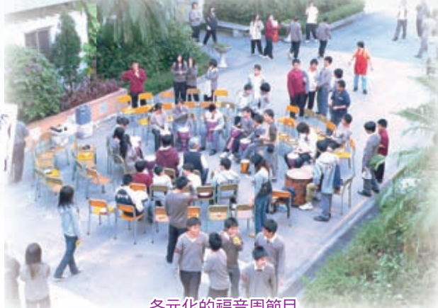
各元化的福音周節目