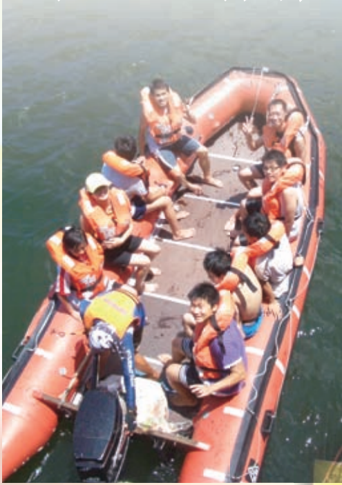
乘風航讓學生挑戰自己的極限