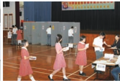
學校舉辦模擬立法會選舉