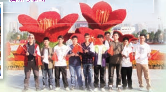
廣州亞運會考察團