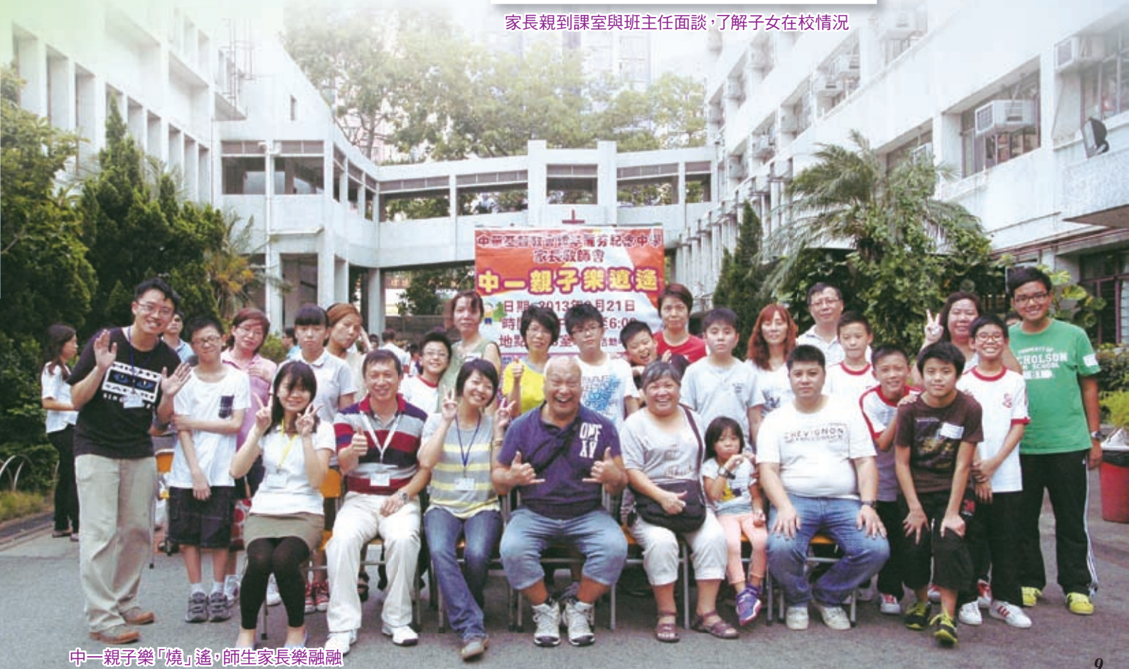
中一親子樂「燒」遙，師生家長樂融融