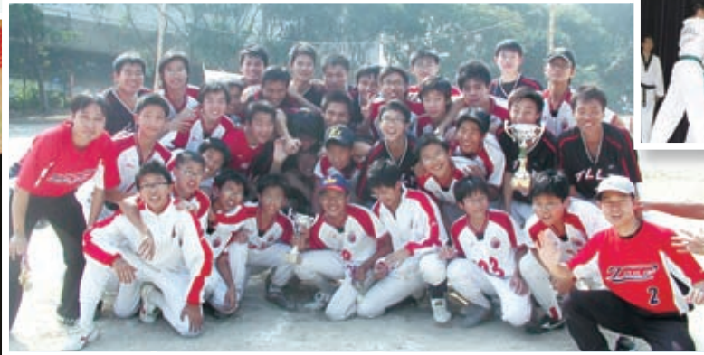
壘球健兒·學界壘球三年霸