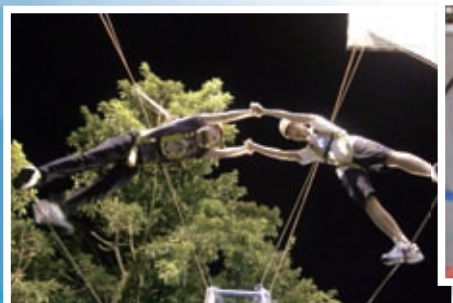
合作無間——高架歷奇訓練