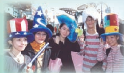
參觀日本迪士尼以了解不同文化