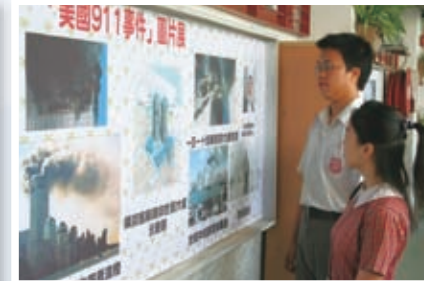
學校進行911周年悼念活動