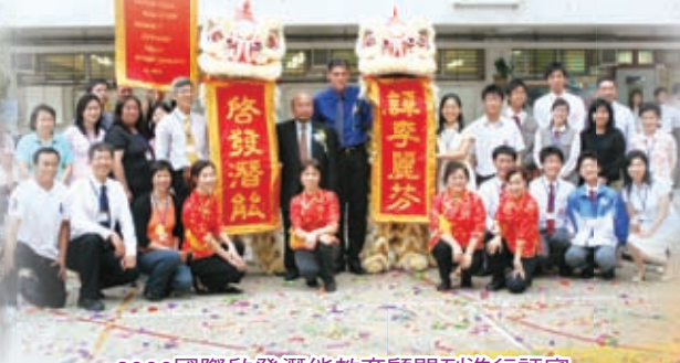
2006國際啟發潛能教育顧問到進行評審