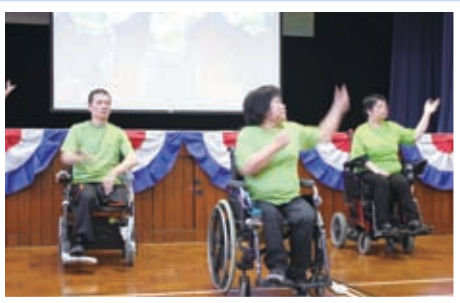
回聲谷傷健福音協會到校分享信息並即表演讚美操

本校各級均設有宗教科，有系統地推行基督教教育。另外，更設有初中團契、高中團契和靈伙樂隊培訓，以小組形式進行屬靈培育，讓學生進一步認識真理，建立正確的人生方向及價值觀。老師亦透過平日早會及周會分享生活體驗，深化同學對信仰之了解。宗教委員會在福音周安排多元化節目，讓同學從多角度認識真理；又舉辦福音營，鼓勵同學更深入思索生命意義。最後，以實際行動參與關懷社區活動，效法基督，關顧他人和社區，實踐使命。