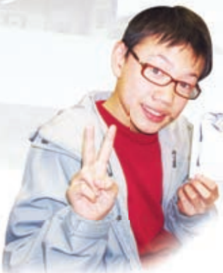
團契聚會繪製慰問咭