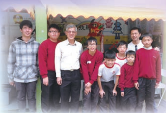
工展會攤位展覽校長到場打氣

本校除了著重良好校風的建立外，亦一直致力推動創新科技教育，以創新及前瞻性的視野，提供科技為本的創意學習環境，讓學生能夠發展創意思維，發揮科技潛能。本校設有創新技研習中心，能提供予學生一個持續優化的創作空間，藉以提高學生對科技創作的知識及興趣，發揮學生潛能；此外，亦藉著創新科技學會活動，發掘科技資優生，發展學生的科技創作潛能及擴闊他們的科技學習領域。最近本校就榮獲全港第一間宋慶齡兒童科技發明示範基地稱號，以及成為「科技顯六藝」新界西分區機械人培訓中心。隨著陳易希同學的全能機械人揚威國際後，2013年本校4名中二及中三級學生代表香港首奪世界VEX機械人錦標賽中學組創意大獎。而每年本校科技創作皆有傑出的成績，近三年，本校就取得近百項的國際性、全國賽及香港的公開比賽獎項，成績驕人。