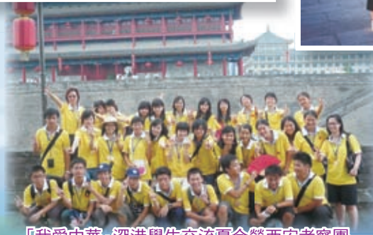
「我愛中華」深港學生交流夏令營西安考察團