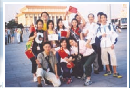
北京國情教育之旅