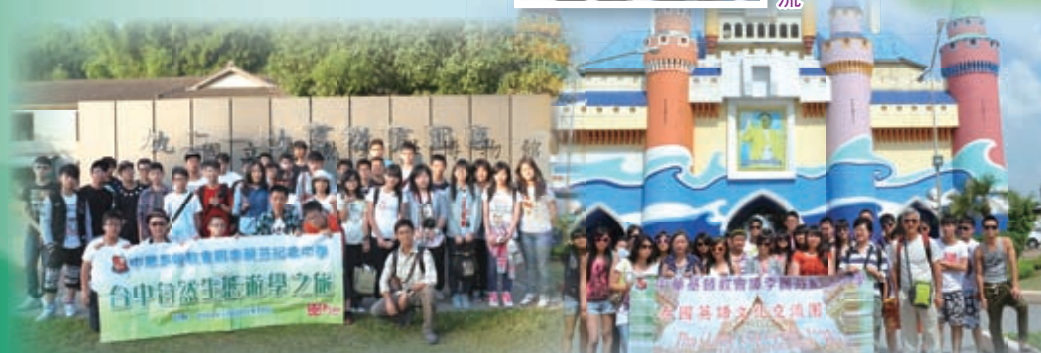
台中自然生態遊學之旅