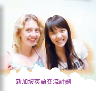
新加坡英語交流計劃