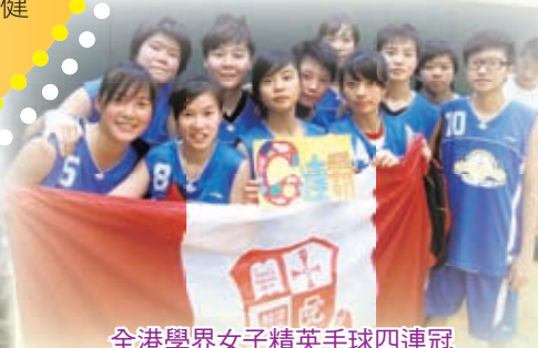
全港學界女子精英手球四連冠