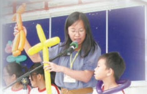
傳道人藉扭汽球講述耶穌的大愛