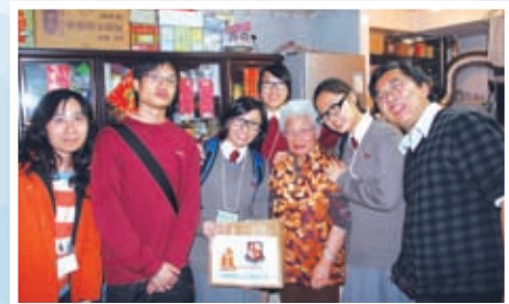
有機種植社區關懷活動——上門烹飪有機蔬菜