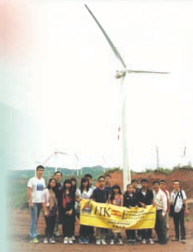
學生科技獲獎 免費參觀雲南大理風電場