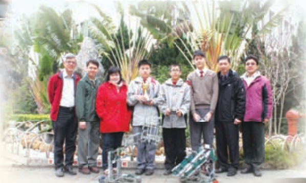
學生榮獲2011香港工程挑戰賽冠軍