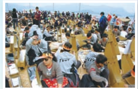
同學參與創造新健力士紀錄——最多人建造太陽能燒烤爐