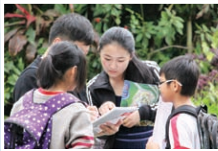
其他學習經歷日——在海洋公園進行專題研習