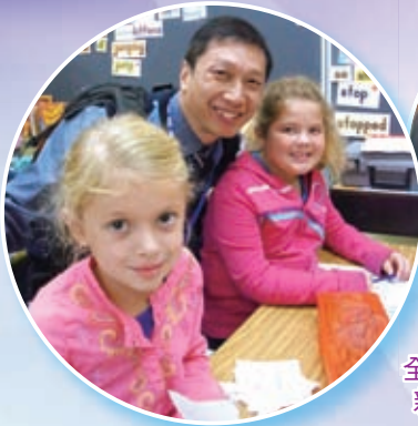
2011啟發潛能教育美國之旅參觀學校