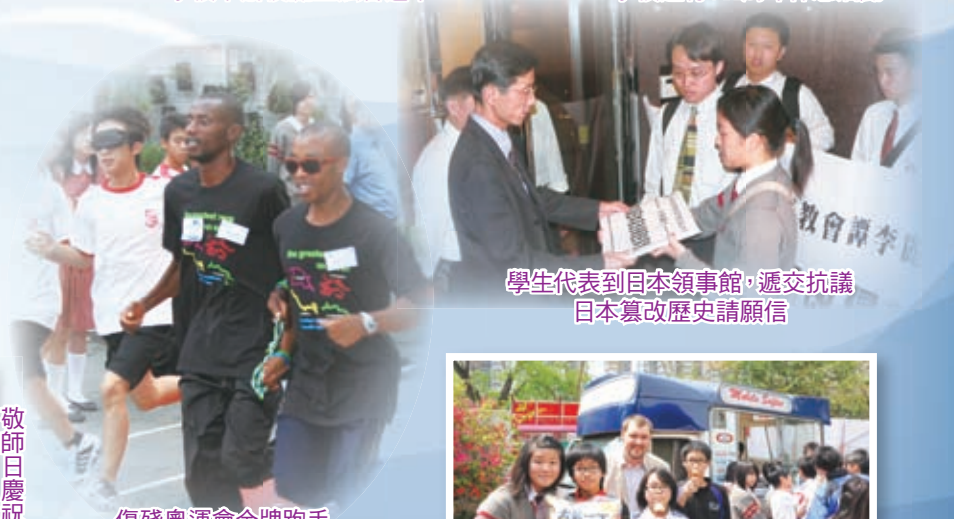
學生代表到日本領事館，遞交抗議日本篡改歷史請願信