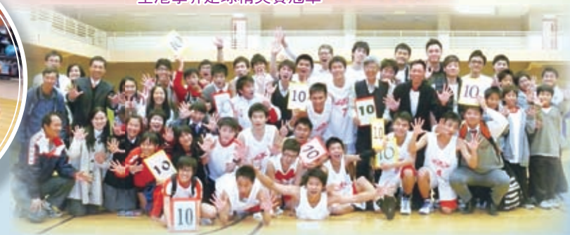
Panasonic全港學界籃球邀請賽冠軍及屯門十連冠