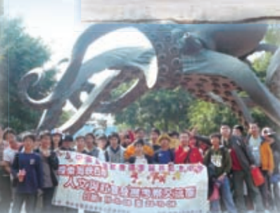
探索海峽西岸人文與社會發展 考察廈門交流團