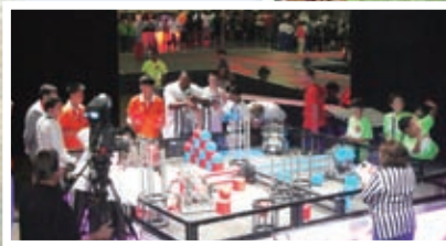
機械人大賽學校代表全程投入