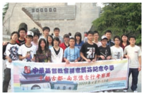
十朝古都——南京懷古行考察團