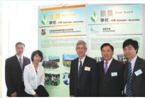
榮獲香港環保卓越金獎