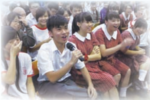
學生於宗教周會投入回應

創天造地之時，神造太陽支配白天；月亮管理黑夜。到了舊約時代，當神的選民以色列人出埃及時，神在曠野日間以雲柱、夜間以火柱，領他們的路，總不離開自己的百姓。今天，學校的天台也豎立了兩個標記——日間看見的「十字架」和夜間光采奪目的「伯利恆之星」。「十字架」表明耶穌犧牲的愛；「伯利恆之星」表明我們的心願——「這裏有愛，我們願意為學生付出一切；這裏有情，我們珍惜每一段關係；這裏有耶穌，師生可以找到永生的盼望；這裏有基督，學校的主權全在乎神。」