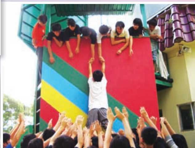
沒有高牆是攀不過的——領袖訓練