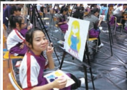
學生透過藝術創作，啟發多元智能