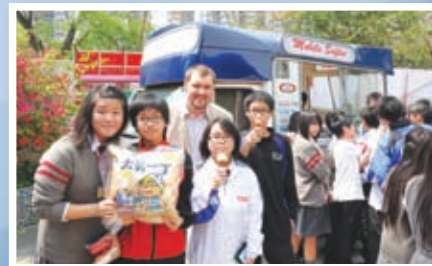
英語周同學踴躍參與