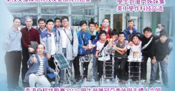
香港工程挑戰賽2012，學生榮獲冠亞季後與主禮人合照