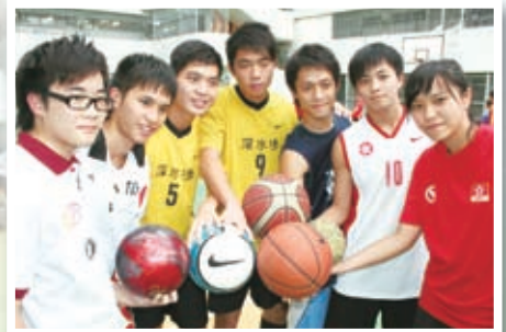
粒粒皆星——保齡、手球、足球、籃球精英