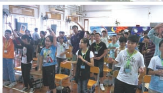
在中一迎新宗教活動中同學的投入表現