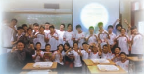
師生共享月餅和生果，慶祝中秋節人月團圓