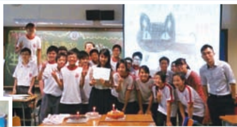
師生關係親厚，學生秘密地為班主任預備surprise birthday party，老師自然驚喜萬分