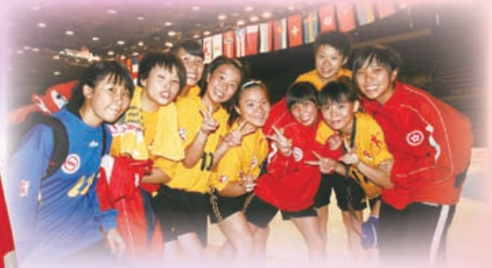
手球代表隊到歐洲斯洛伐克世青盃比賽