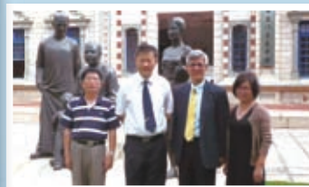
與廈門百年老校集美中學結為姊妹學校