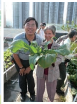
環保推廣： 長者綠色教育活動