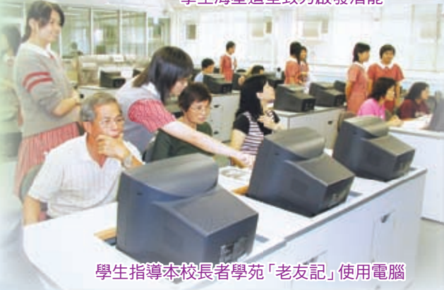
學生指導本校長者學苑「老友記」使用電腦