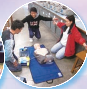
全校老師除具急救證書資歷外，新增修讀自動體外心臟去纖維性氈動法課程

本校相信良好的學校管理能提升學與教的效能，令學生直接得益。學校的管理以人為本，重視同工的感受，照顧同工的需要：定期為老師舉辦健康講座，更添置按摩椅，幫助老師減壓，消除疲勞。積極的溝通，提升了團隊的士氣，並榮獲良好人事管理獎。