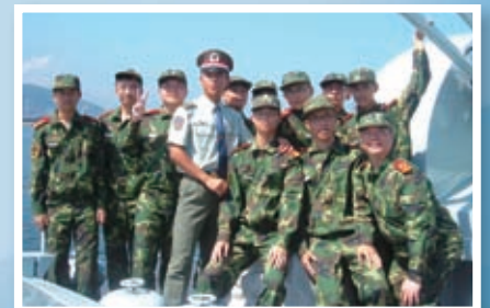
駐港解放軍舉辦的軍事夏令營