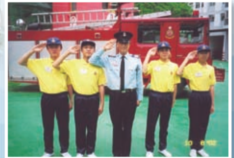
學生參加消防訓練營培養自律