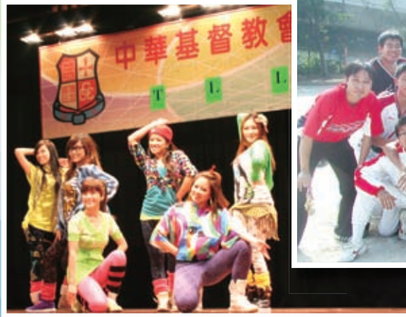
學生表演流行舞蹈