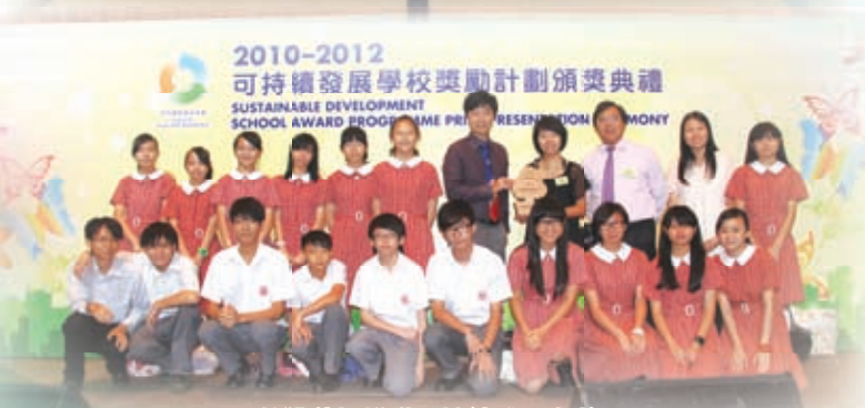
榮獲積極推動可持續發展大獎