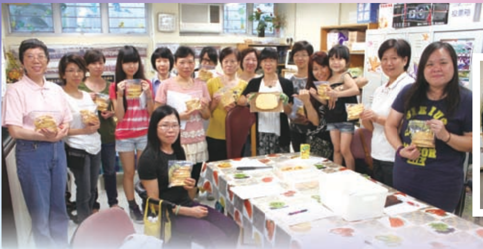
好香啊！原來家長製作的杏仁曲奇餅剛出爐