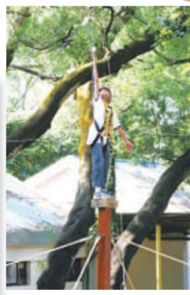
同學在福音營中向難度挑戰