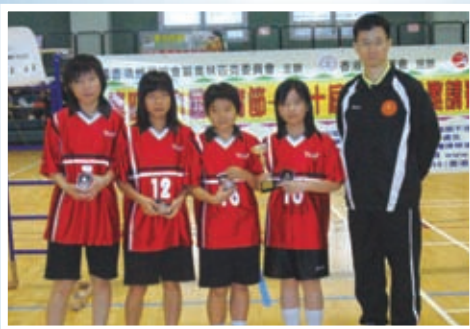
成立四年的足毬隊·榮獲第十二屆學界比賽 隊際亞軍