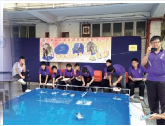
再生能源創意小艇大比拼