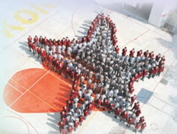
學生海星造型致力啟發潛能

中華基督教會譚李麗芬紀念中學自2003年開始推行「啟發潛能教育」，以「啟發潛能教育」的五個信念：信任、樂觀、尊重、刻意安排及關懷為經，海星五爪為喻的教育範疇：人物、地方、政策、計劃及過程為緯，刻意配合學生的需要及教育發展趨勢，打造「啟發潛能教育夢工場」。學校早於2006年獲頒「國際啟發潛能教育大獎」，2011年更上一層樓，獲得「國際啟發潛能教育成就大獎」，進一步肯定學校對教育、家長、師生及社區所作出的貢獻。學校堅守「啟發潛能教育」的信念及致力推行「啟發潛能教育」所得的成果豐碩，包括：卓越的學與教表現、突出的課外活動及科技成就，致力打造的「綠色學校」及豐富多姿的公民教育活動等。表現出類拔萃，成績有目共睹。學校相信每一個學生都各有所長，在譚李麗芬優良的師資、完備的設施及良好的學習環境配合下，透過啟發潛能教育，學生定會潛能盡顯。