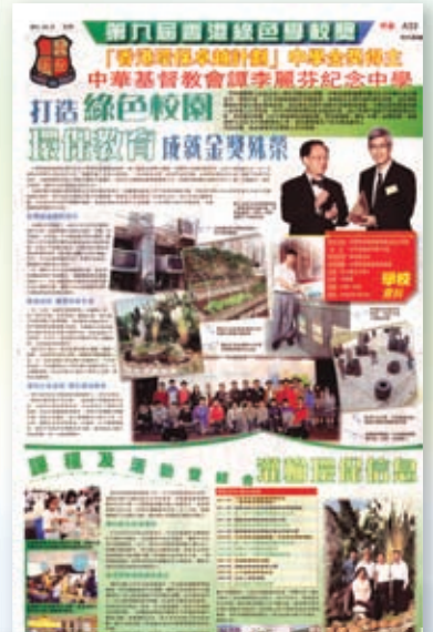
學教卓越、啟發潛能、綠色學校媒體報導