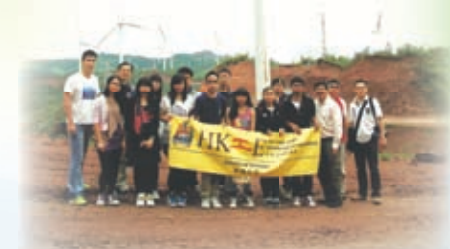
雲南環保風力發電考察