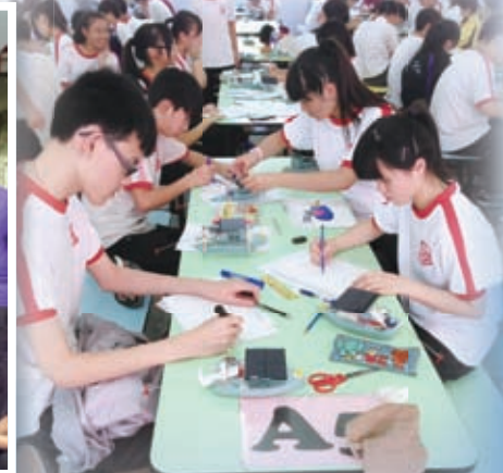
再生能源創意小艇大比拼工作坊