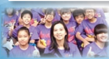
陸運會上同學穿著自己設計的班衫，為健兒們齊聲打氣