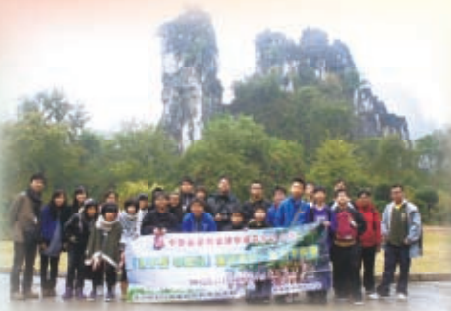
富民興桂廣西考察團