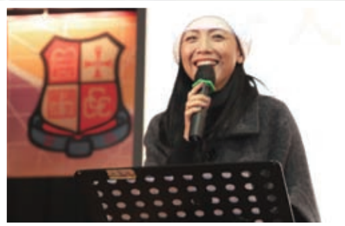
視后鄧萃雯小姐到校作佈道會見證嘉賓