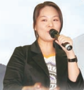
福音歌手劉婉玲到校分享