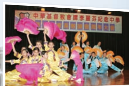
學校舞蹈組演出東方舞