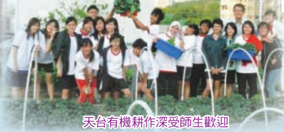
天台有機耕作深受師生歡迎