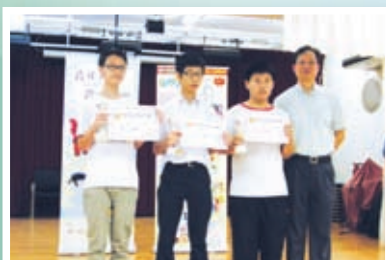
學生榮獲青年科技習作比賽二等獎