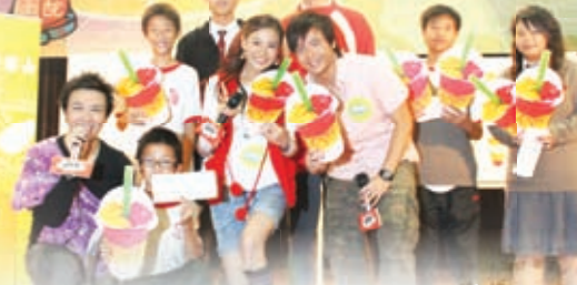
School Tour 到校宣揚健康訊息