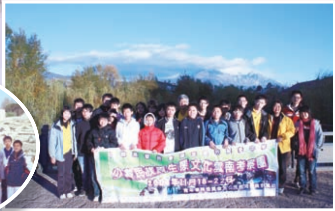
少數民族原生生態文化雲南考察團