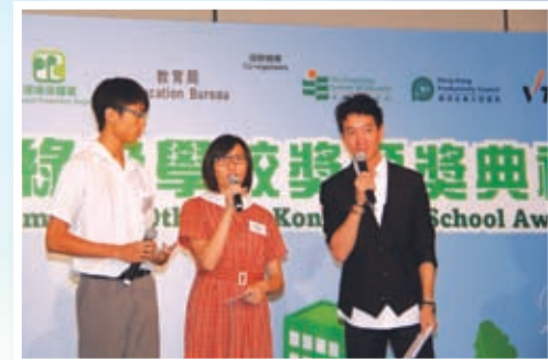
在金獎頒獎禮上學生介紹學校可持續發展的特色活動