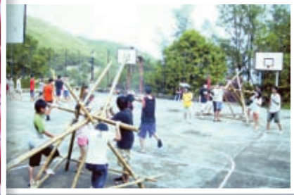
傑出領袖培訓，學生自行建造羅馬架，提升解難能力和團體精神