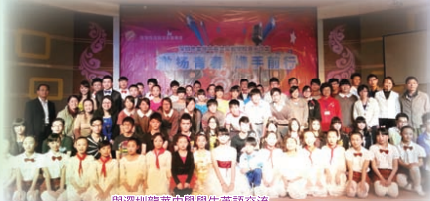
與深圳龍華中學學生英語交流