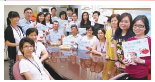
家長也敬師，文具賀咭表心意