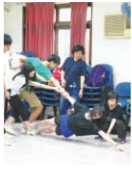
建立團隊合作精神——福音營花架