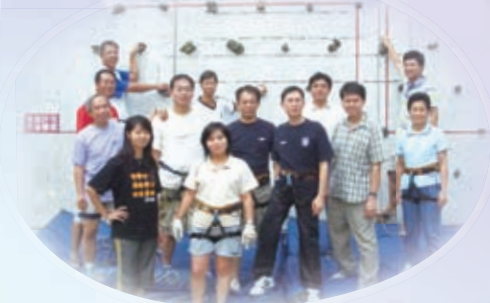
本校推行攀登文化，提升學生抗逆能力