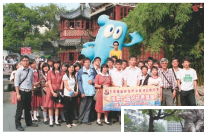
探索上海今昔考察團