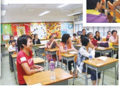
家長踴躍投票，成功選出第八屆家教會常務委員