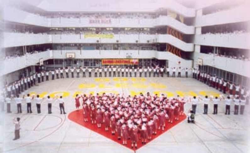
全校參與「心連心抗災大行動」，為逆境的香港送上祝福及支持