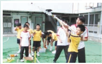
環保推廣：教導小學生製造環保水火箭