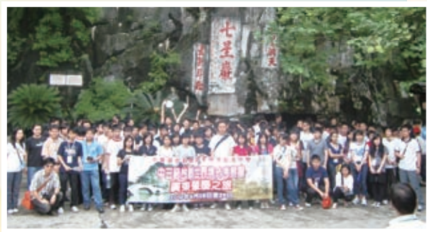
廣東肇慶七星巖考察團