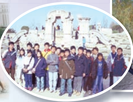
「赤子情 中國心」北京考察團