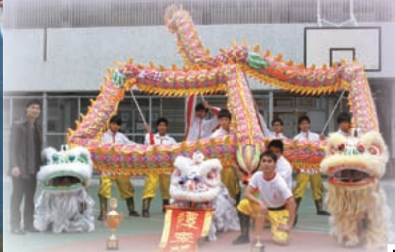
多次獲邀慶典表演的龍獅隊