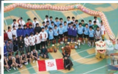
校隊精英陣容鼎盛