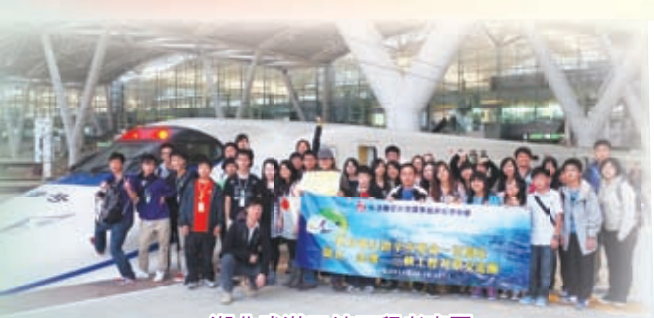
湖北武漢三峽工程考察團