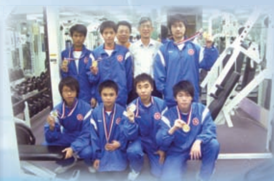
全港舉重錦標賽大力王·七位港隊成員