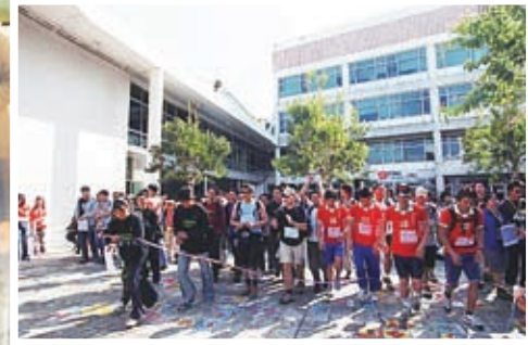
自2003年師生參與突破機構逆境先鋒為青少年籌募捐款活動