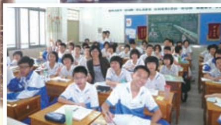
與佛山中學作英語交流