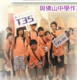
參觀上海世博希臘館