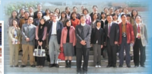
本校與深圳松泉中學暨北師大外語實驗學校締結為姊妹學校，並由本校老師為松泉中學學生進行即場英語試教，為日後專業交流計劃展開序幕