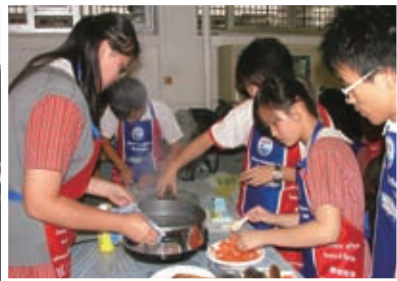
以三文魚為主菜，學生齊來作天才小廚師