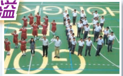
開學時各班都花盡心思，務求拍出精彩的班相

班主任了解學生表現及喜好，藉班務分配、班會活動、陸運會和班際比賽等活動，增進師生及學生之間的凝聚力和互助精神。