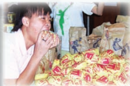
翻生樂園餐佈道會