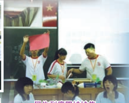
學生到廈門姊妹集美中學作科技交流