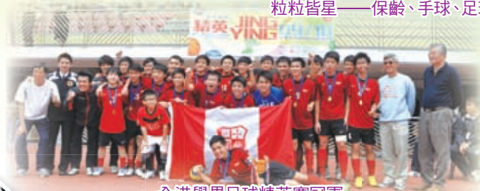
全港學界足球精英賽冠軍