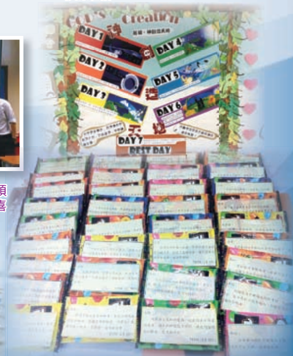
節慶時老師窩心地為學生預備小禮物，更會送上鼓勵的心意咭