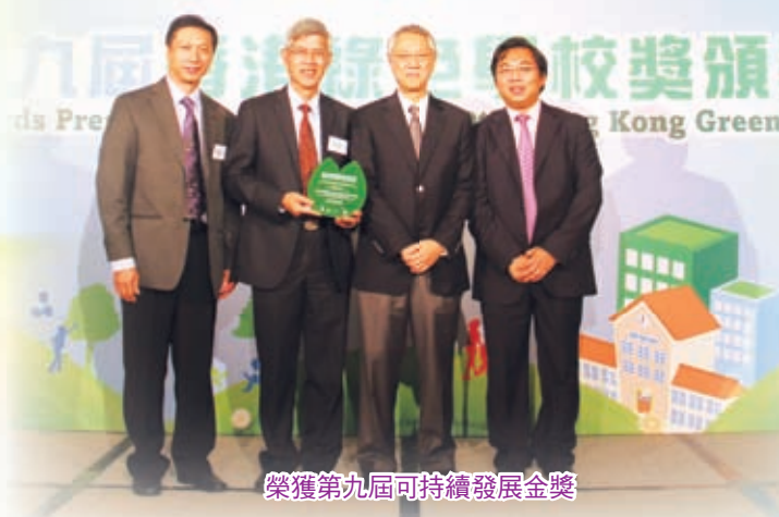
榮獲第九屆可持續發展金獎