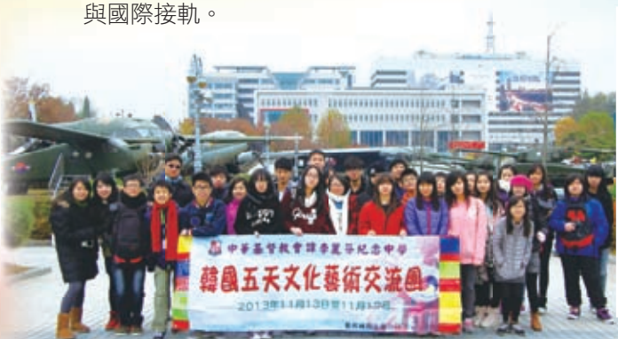
考察韓國文化藝術交流團