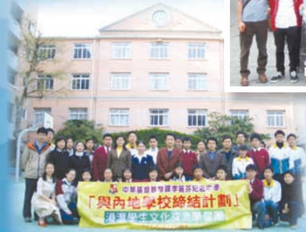
與上海北虹高級中學學生進行兩地文化交流