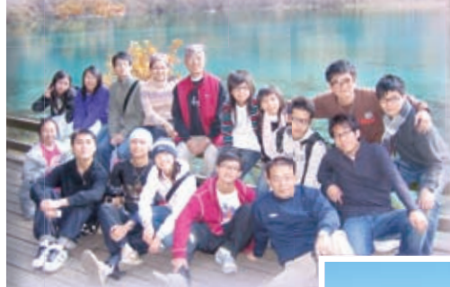
世界文化與自然遺產 保護四川考察團