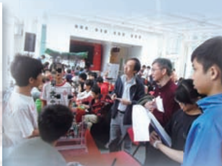
本校代表向評判介紹所設計的機械人