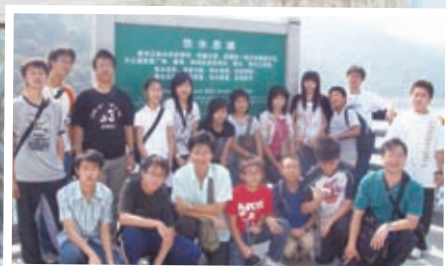
河源「飲水思源」考察團