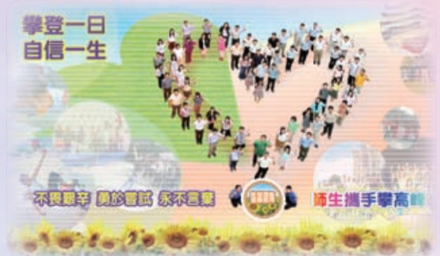
攀登一日 自信一生