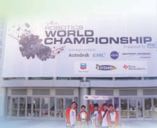
本校師生代表參加美國洛杉磯世界VEX機械人錦標賽