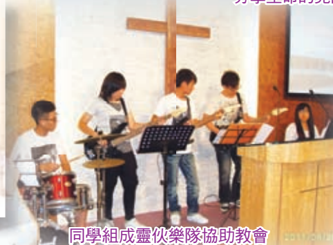
同學組成靈仗樂隊協助教會帶領佈道會的詩歌敬拜