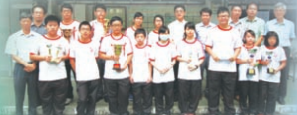
校長於早會頒獎，表揚創新科技隊成員屢獲殊榮，為校爭光