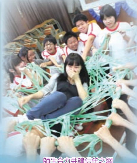
師生合力共建信任之網