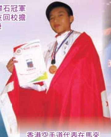
香港空手道代表在馬來 西亞國際賽奪冠