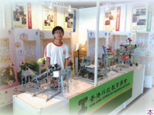
創新科技嘉年華2012攤位展覽