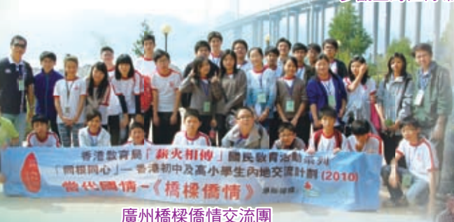
廣州橋樑僑情交流團