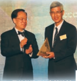
學校榮獲環保卓越計劃中學組金獎