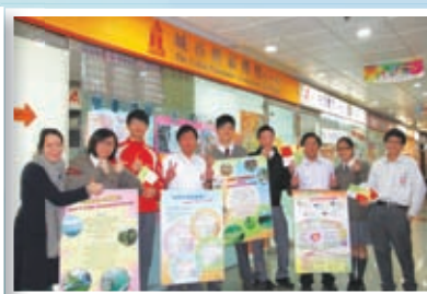
學生接受培訓後參與社區關懷活動