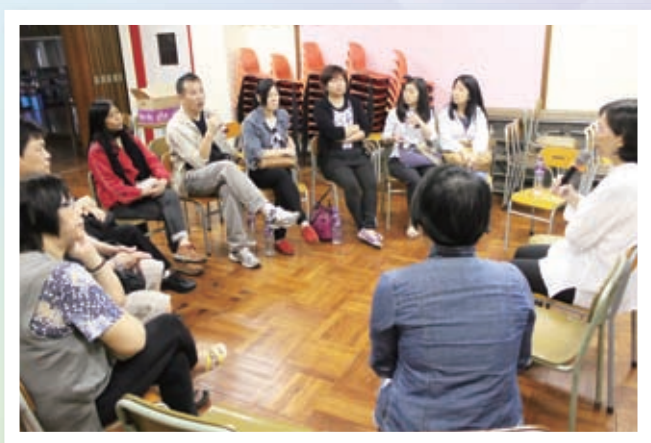
專家與家長交流教子心得，學以致用