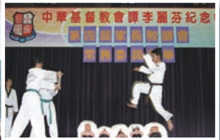
跆拳道高手·身手不凡—— 跆拳道表演